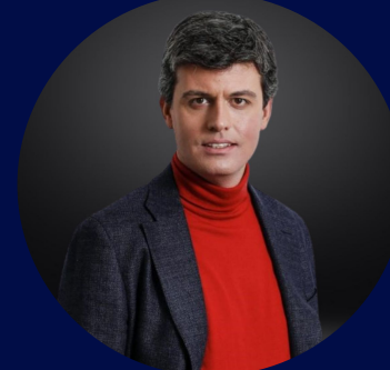
Gaspard Koenig Philosophe, essayiste, romancier et homme politique français