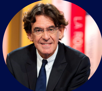
Luc Ferry Professeur de philosophie, essayiste et homme politique français