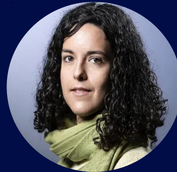
Manon Aubry Députée européenne