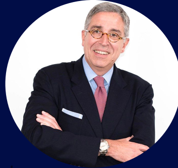
Arnaud de Puyfontaine PDG de Vivendi