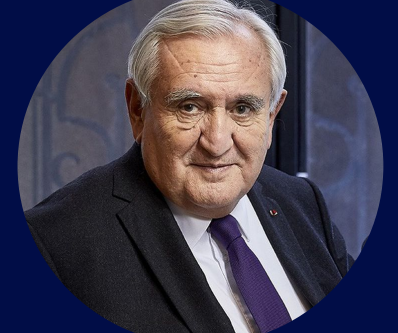
Jean-Pierre Raffarin Ancien Premier ministre français Fondateur de ESCP Tribunes