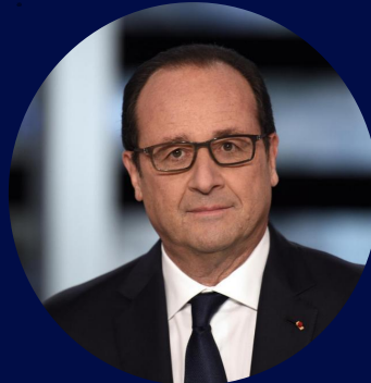
François Hollande Ancien président de la République française