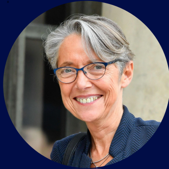
Élisabeth Borne Première ministre française