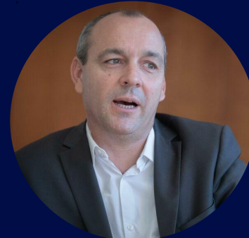
Laurent Berger Syndicaliste français Ancien secrétaire général de la CFDT