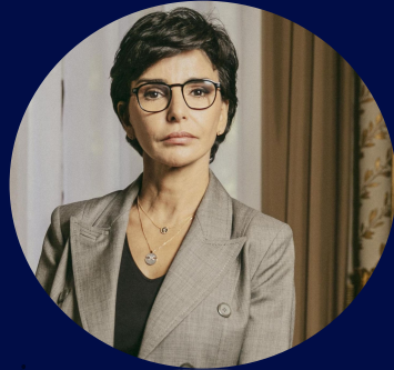
Rachida Dati Ancienne ministre de la Justice française