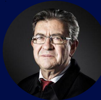
Jean-Luc Mélenchon Homme politique français