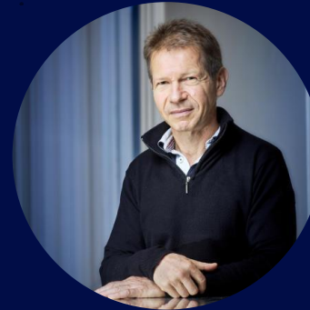
Jean-Marc Jancovici Ingénieur et enseignant français