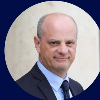
Jean-Michel Blanquer Ancien ministre de l'Éducation nationale