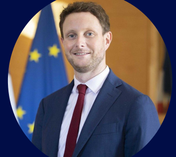
Clément Beaune Ministre délégué chargé des Transports