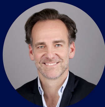
Renaud de Lesquen

Haut fonctionnaire, homme politique et avocat français