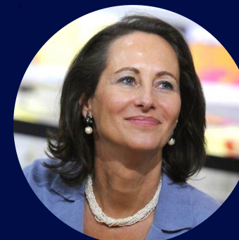
Ségolène Royal Femme politique française