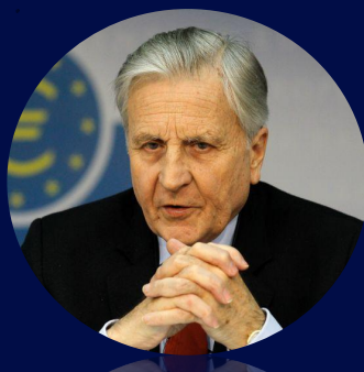
Jean-Claude Trichet Haut fonctionnaire français Ancien président de la BCE