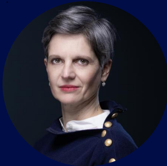
Sandrine Rousseau Économiste et femme politique française