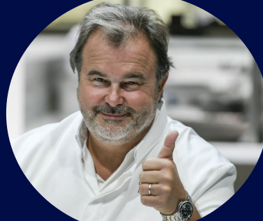
Pierre Hermé Chef pâtissier-chocolatier français